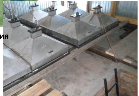
Рис.3. Установки для исследования космических лучей