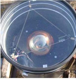
Tunka-133 - 175 optical detectors on the area of 3 km 2