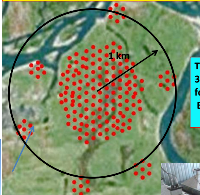
Tunka- Grande – 380 scintillation counters for detection of EAS charged particles