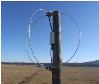
Tunka-REX – 64 antennas for detection of radio signals from EAS