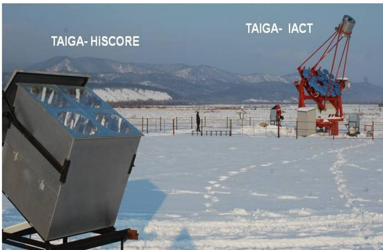
Рис.1. Базовые компоненты обсерватории TAIGA - широкоугольный черенковский детектор установки TAIGA-HiSCORE и атмосферный черенковский телескоп TAIGA-IACT.

телескопов, регистрирующих черенковское изображение широких атмосферных ливней (ШАЛ) и широкоугольных черенковских детекторов (Рис.4).